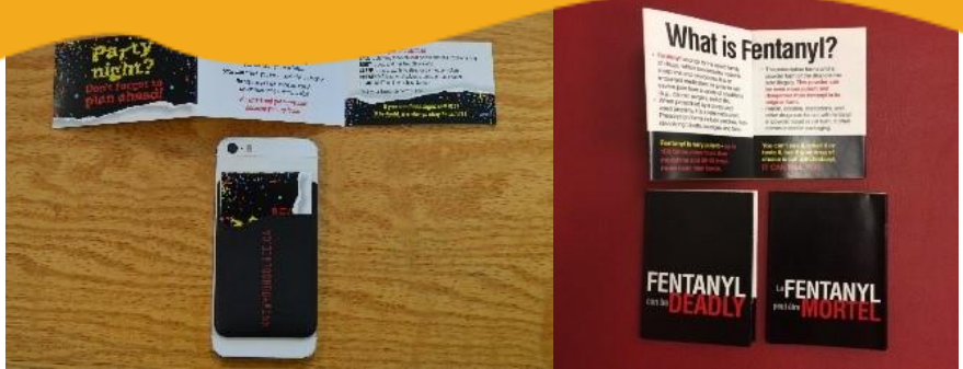
Dépliant informatif sur la sécurité en soirée