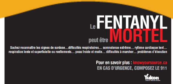
Annnonce affichée dans les transports en commun