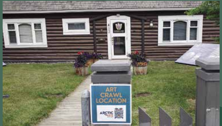
La maison Taylor faisait partie de l'Art Crawl au Sommet des arts de l'Arctique.