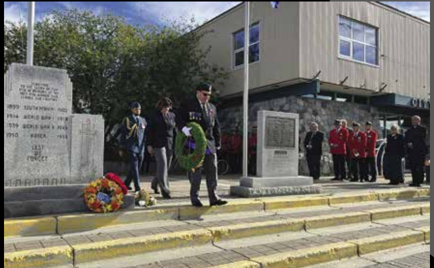
→ Dépôt de la couronne

En septembre 2022, nous avons commémoré la vie de la reine Elizabeth II. Pour l'occasion, la commissaire a participé à une cérémonie commémorative de visionnement des funérailles depuis Ottawa, a déposé une couronne à la mémoire de la Reine lors d'un événement organisé par la Légion de Whitehorse et a invité la population à se rassembler pour une marche commémorative le long du fleuve Yukon.