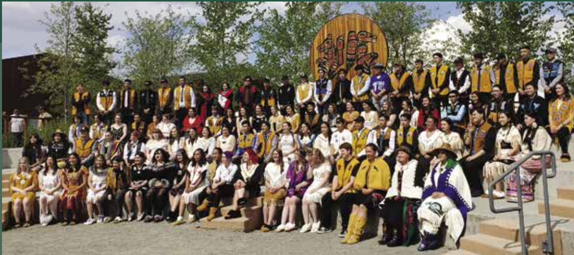
Remise des diplômes des élèves des Premières Nations.