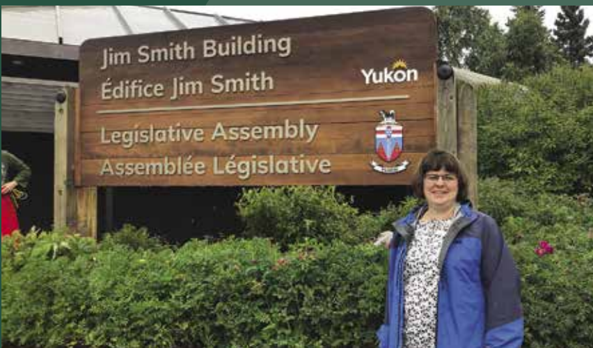
Inauguration de l'édifice Jim Smith .