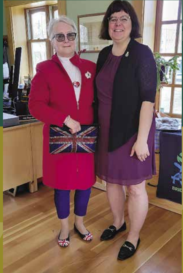
Une admiratrice royale

En mai 2023, la commissaire a organisé une journée portes ouvertes pour souligner le couronnement du roi Charles III. La population yukonnaise était invitée à venir prendre le thé et le goûter à la maison Taylor, à recevoir l'épinglette du couronnement et à visiter l'exposition sur la famille royale au Yukon.