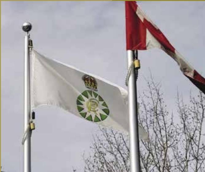
Drapeau du couronnement