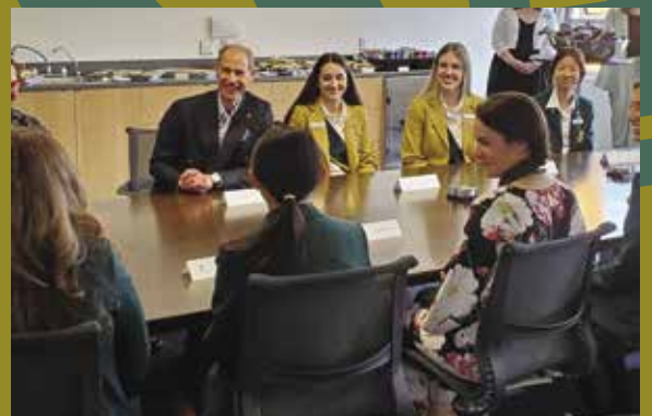
Le duc d'Édimbourg à l'école York House.