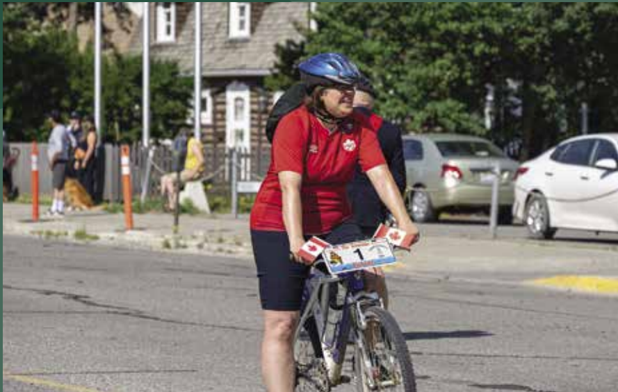
À vélo au défilé de la fête du Canada.