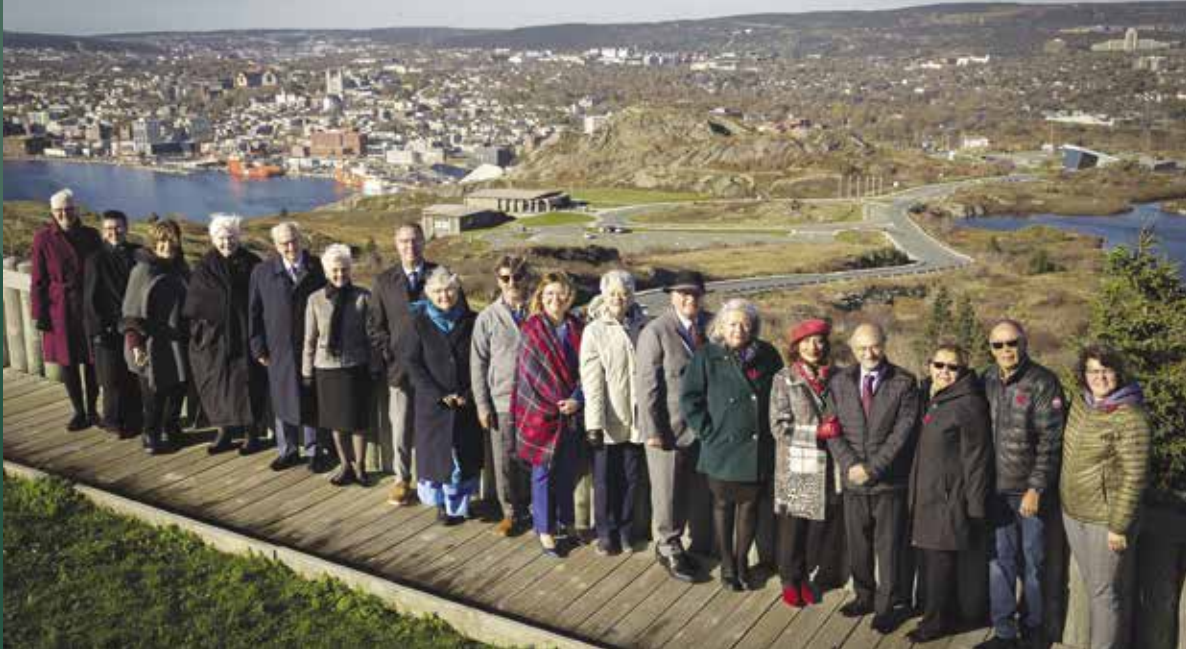
Conférence annuelle de la gouverneure générale, des lieutenants-gouverneurs et des commissaires territoriaux à St John's.