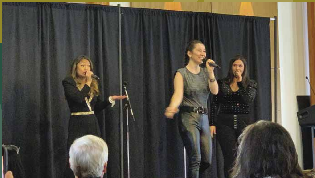
Pipeline Vocal Project (PVP).

En mai 2022, la commissaire a organisé un événement en collaboration avec le consul général des États-Unis à Vancouver, D. Brent Hardt, pour souligner le Mois du patrimoine asiatique au Canada et le Mois du patrimoine des Américains d'origine asiatique et des îles du Pacifique. Ils ont accueilli le trio de chant a capella de l'Alaska Pipeline Vocal Project (PVP).