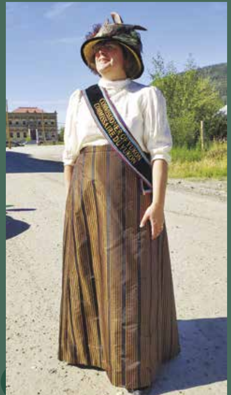
Défilé du jour de la Découverte à Dawson.