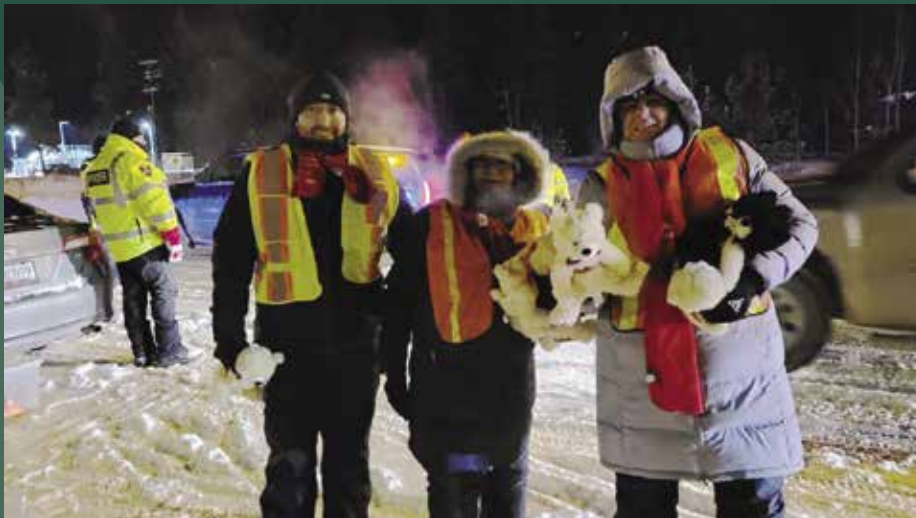
Participation à un contrôle routier en décembre 2022 avec MADD Whitehorse et la GRC.