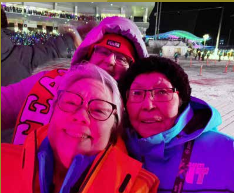
Les trois commissaires nordiques.