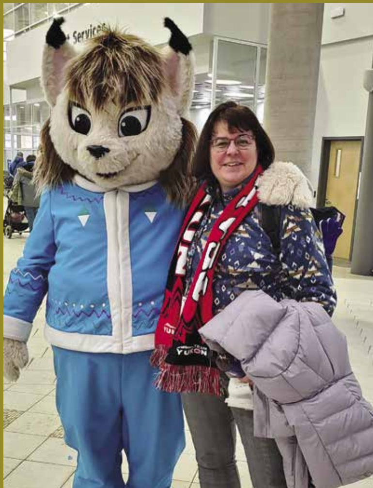
La mascotte des JHA.

Du 29 janvier au 4 février 2023, la commissaire a assisté aux Jeux d'hiver de l'Arctique à Fort McMurray, en Alberta. Elle a pris part aux cérémonies d'ouverture et de clôture, remis des ulus (médailles) en ski de fond et en raquette, assisté au gala culturel et encouragé les athlètes d'Équipe Yukon dans de nombreux sports.