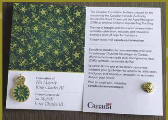
Épinglette du couronnement