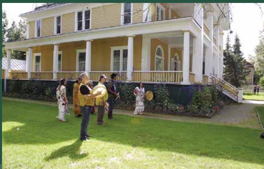
Hän Singers à la résidence du commissaire à Dawson