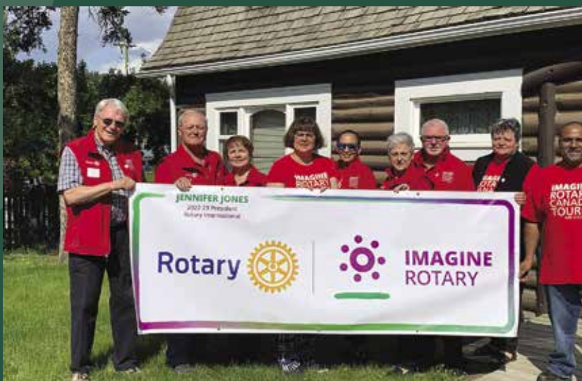
Visite de la présidente 2022-2023 du club Rotary international à la maison Taylor.