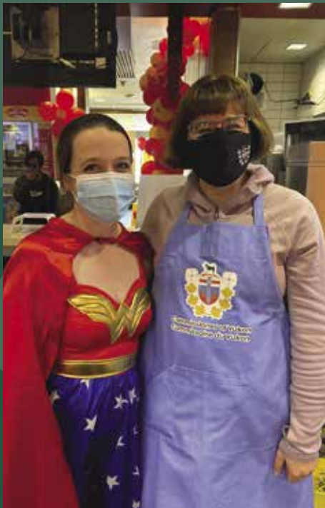
À l'occasion du Grand McDon.