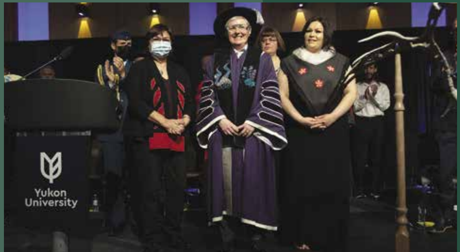
Installation de la rectrice de l'Université du Yukon.