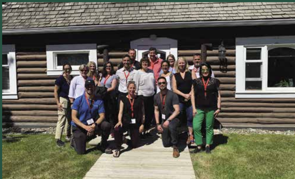
Visite des participants et participantes de la Conférence canadienne du Gouverneur général sur le leadership à la maison Taylor.