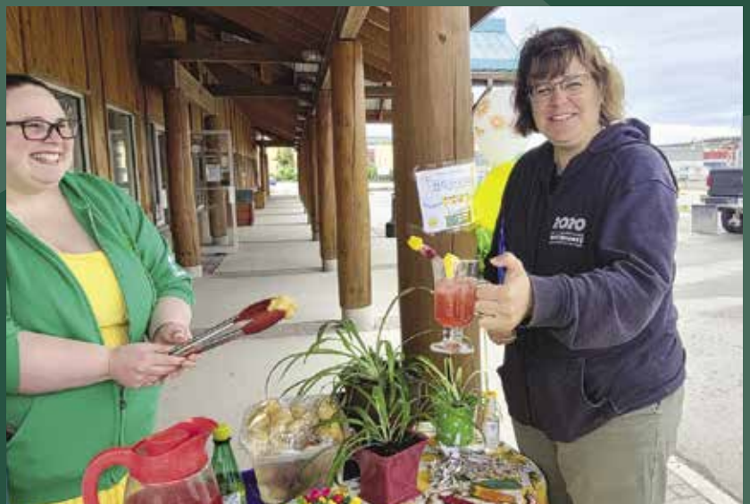
Au stand de limonade Big Squeeze des Grands Frères Grandes Sœurs du Yukon.