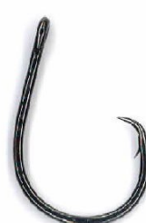
Hameçon circulaire avec ardillon

L'expérience montre que les hameçons circulaires sont idéaux pour les lignes fixes. Selon nos essais, les meilleurs accessoires consistent en un hameçon circulaire de taille 2/0 sans ardillon, monté sur un avançon monofilament de 40 livres de résistance fixé au moyen d'une boucle parfaite ou d'un nœud Rapala, ce qui permet à l'hameçon de pivoter librement lors de l'hameçonnage. Ces accessoires permettent un taux de prises élevé, de capturer systématiquement la lotte dans le coin de la bouche et de faciliter le retrait de l'hameçon du poisson.