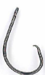
Hameçon circulaire sans ardillon