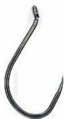
Hameçon en J sans ardillon

La pointe du crochet des hameçons circulaires est différente de celle des hameçons en J, en ce sens qu'elle est recourbée vers la hampe de l'hameçon. Grâce à cette conception, le crochet se fixe uniquement quand il atteint le coin de la bouche alors que le poisson s'éloigne avec l'appât, l'hameçonant ainsi à cet endroit plutôt que dans la gorge ou l'estomac. Il est également plus difficile pour les poissons de recracher un hameçon avec une pointe recourbée, même lorsqu'il s'agit d'un hameçon circulaire sans barbe.