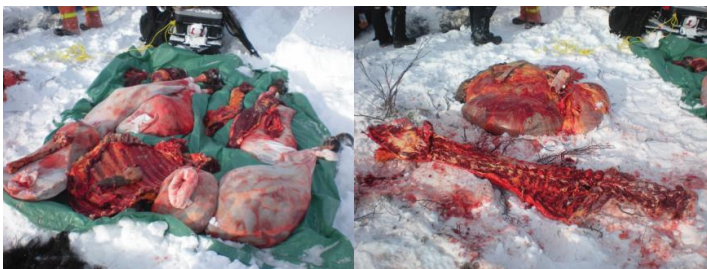
À gauche : Bison éviscéré et dépecé comme il se doit. Toute la viande a été retirée de la carcasse.

Les seules parties de l'animal qu'on devrait laisser sur le terrain sont les viscères, la colonne vertébrale et, si on veut, la tête et la peau. On peut laisser les autres os seulement si toute la viande en a été retirée. Il est interdit de laisser de la viande sur le terrain.